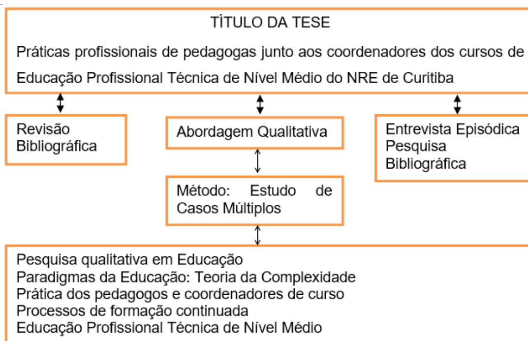
Figura 2 - Desenho da Pesquisa