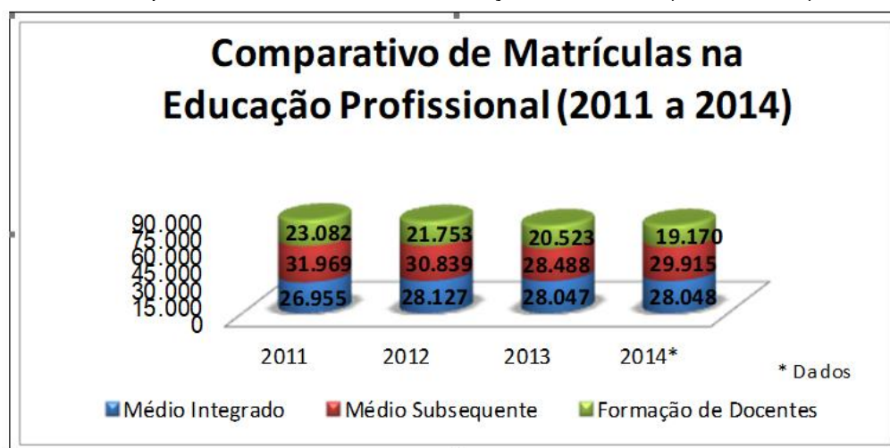
Gráfico 1 - Comparativo de Matrículas na Educação Profissional (2011 a 2014)